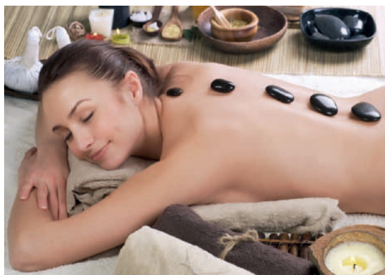
Wer Glück hat, kann sich mit Gutscheinen sogar günstig verwöhnen lassen.

Eine Reihe von Portalen bietet Gutscheine an; die größten sind